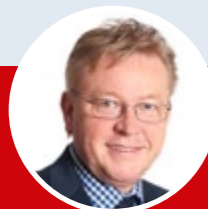
Hans-Jürgen Lütje Bürgermeister Gemeinde Büsum